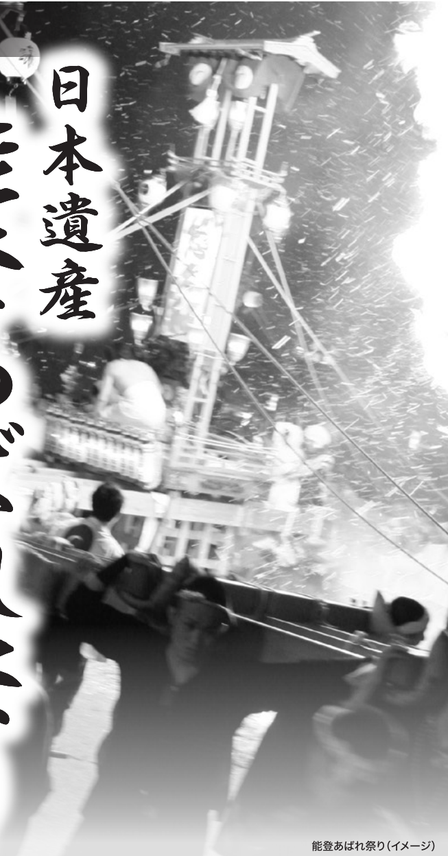
能登あばれ祭り(イメージ)