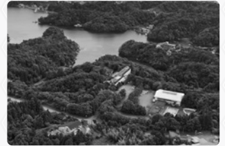
空からのホテル全景