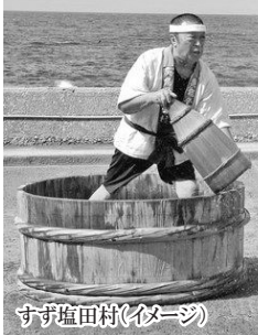
すず塩田村(イメージ)