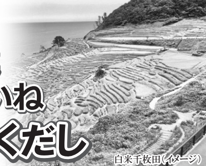
白米千枚田(イメージ)