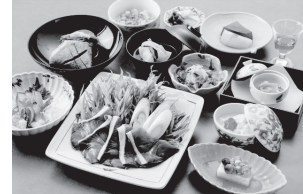
イメージ写真(ご夕食の一例)

【お通し】 蕪すし 【先附】 里山の幸盛り合わせ 【向附】 地魚盛り合わせ 【蓋物】 大浜大豆お手豆腐 【小鍋】 鰯しゃぶしゃぶ 【煮物】 鰯大根 【酢の物】 鰯なます 【お食事】 荒磯ご飯 【留物】 蟹真煮 【漬物】 二種 【水菓子】 春を待つ大地の恵み